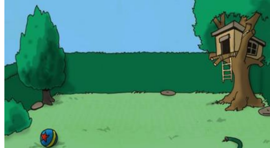
في الفناء الخلفي