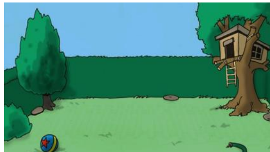
На заднем дворе