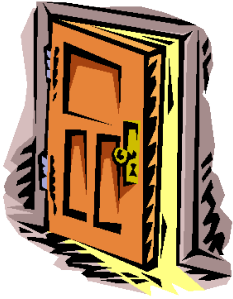
En el armario