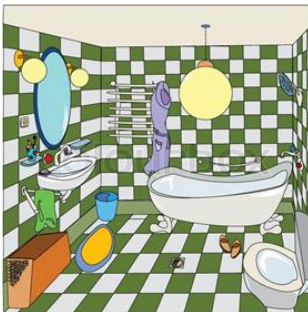
En el baño